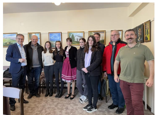
Gemeinde auf Partnerschaftsbesuch. Mit dabei waren auch die Austauschülerinnen, die 2024 in Neuhaus a.Inn waren.