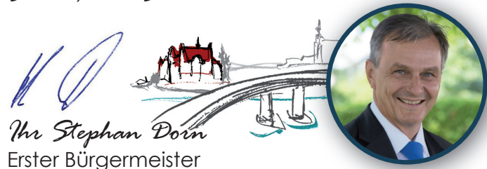
Ihr Stephan Dorn Erster Bürgermeister